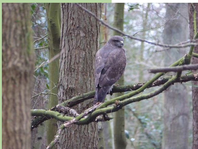
Buizerd of havik?