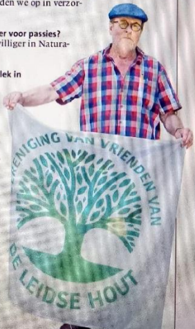
Werner in de krant!

Tekst: Maarten Baanders