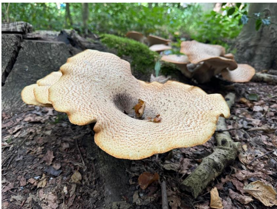
Flinke zadelzwammen gespot!