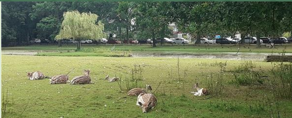
De hertenkamp is met minstens drie hertjes uitgebreid.

De natuur in het park en Werner in de krant!